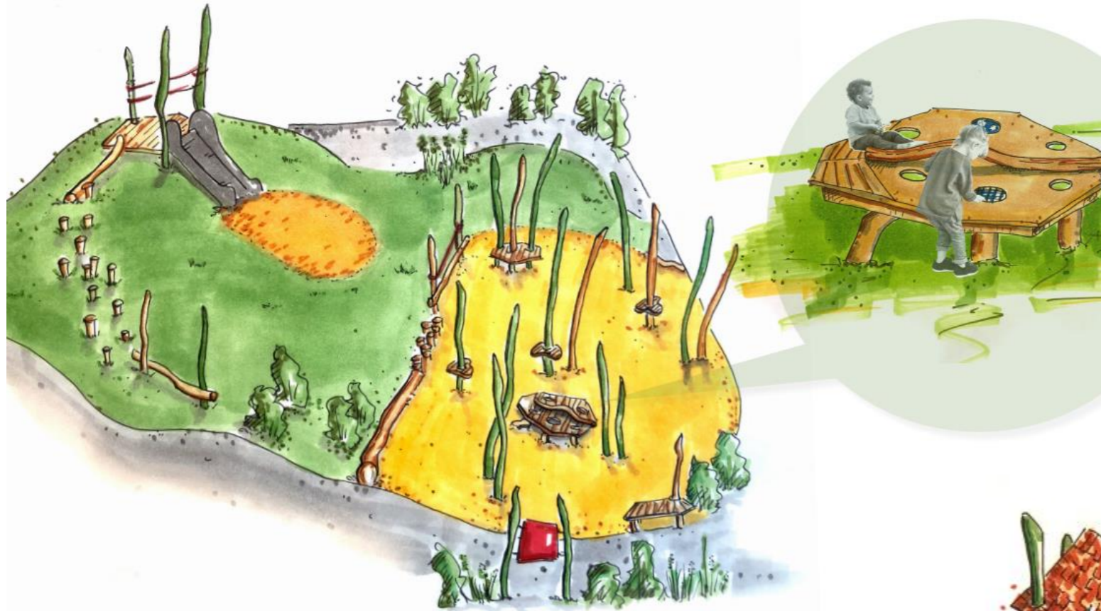
Kleinkindbereich mit Marienkäfer-Sandspieltisch, Kleinkindrutsche, Balancier- und Kletterpfad