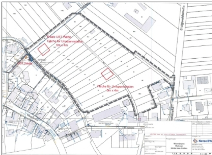
Abbildung 2: Standorte Planung zur Offenlage (alt)

Die ursprüngliche Planung zur Offenlage des Bebauungsplanentwurfs sieht die oben dargestellten Standorte innerhalb des Plangebiets vor. Die im Planteil zum Bebauungsplan gekennzeichnete Fläche südlich des WA 7 (Seniorenwohnen) ist als Regenwasserabflusstrasse von jeglichen Hindernissen freizuhalten, weshalb die Umspannstation nicht unmittelbar an die Straße herangerückt werden kann.