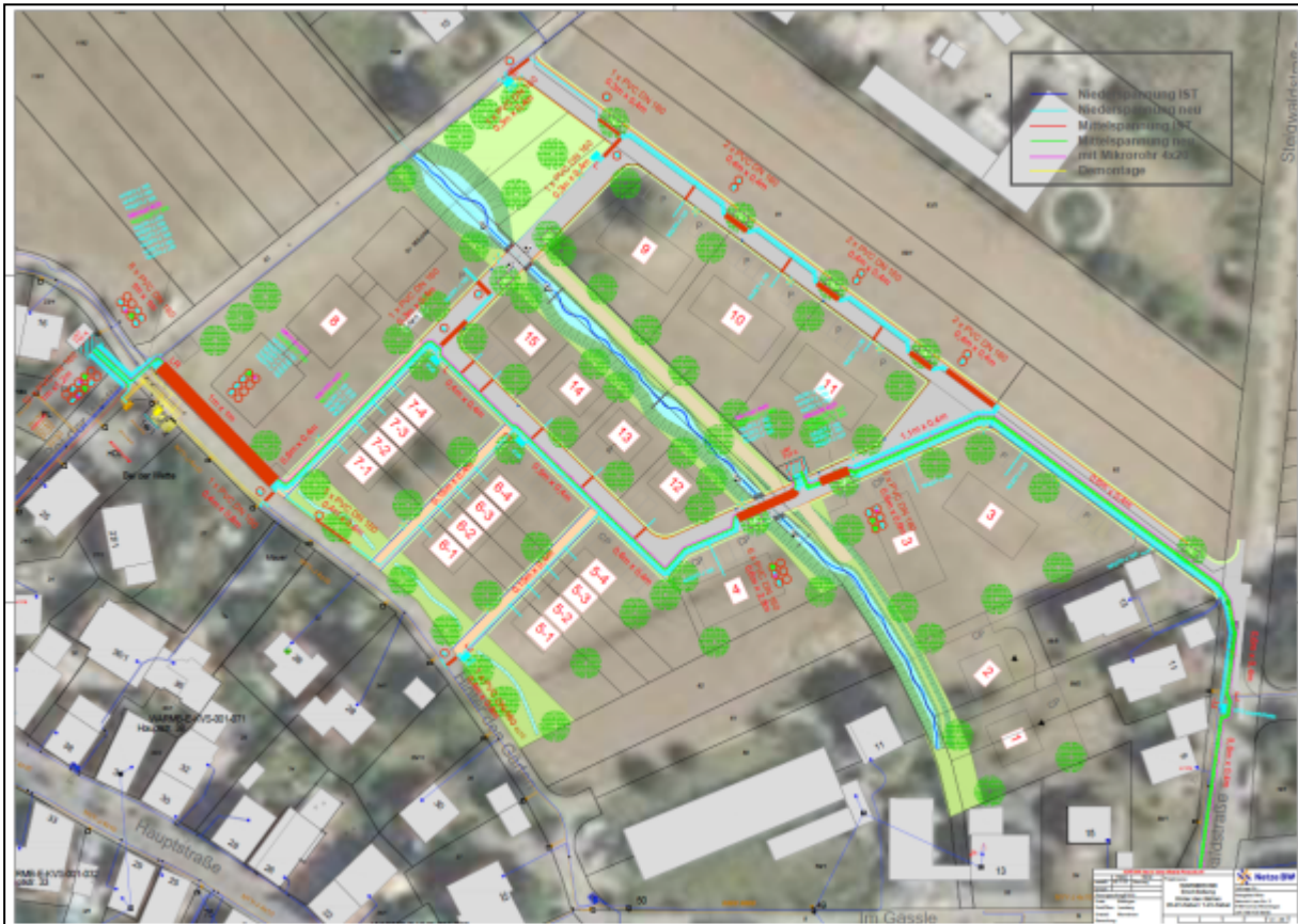
Abbildung 3: Planung Umspannstation Alternative Flurstück Nr. 23/5

städtische Grundstück Flst. Nr. 23/5 außerhalb des Plangebiets, entfallen öffentliche Stellplätze. Eine Kompensation der Stellplätze ist nicht vorgesehen. Zur Straße "Hinter den Gärten" hin, steht ein Baum. Von Seiten der Netze BW soll dieser nach Möglichkeit erhalten werden, dies kann zum gegenwärtigen Zeitpunkt jedoch nicht garantiert oder gewährleistet werden. Hierzu muss eine Begutachtung des Baumes erfolgen. Der Bebauungsplan „Ortskernsanierung Warmbronn“ Teil 1 (15.01.1980) weist dem Flurstück Nr. 23/5 „öffentliche Parkflächen“ zu. Durch die Zulassung der Trafostation entsteht kein planungsrechtlicher Konflikt, diese ist über § 14 Abs. 2 BauNVO als Ausnahme genehmigungsfähig.