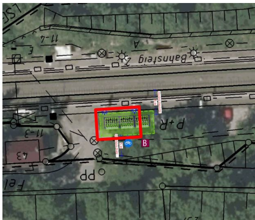
Abbildung 3: Gestaltung Fläche B