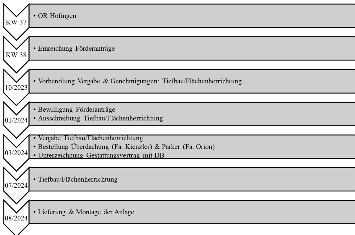
Abbildung 6: Zeitplan

Bei zeitnaher Einreichung der Förderanträge und unter Beachtung der Wartezeiten ist mit einer Förderentscheidung Anfang 2024 zu rechnen. Bei positivem Bescheid sind Bau und Inbetriebnahme der Anlage bis September 2024 avisiert.