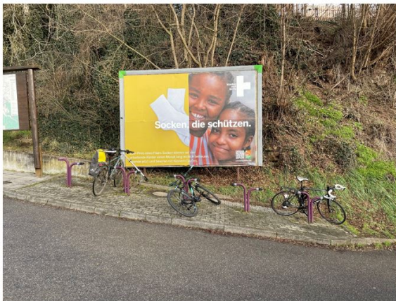
Abbildung 2: Gestaltung Fläche A